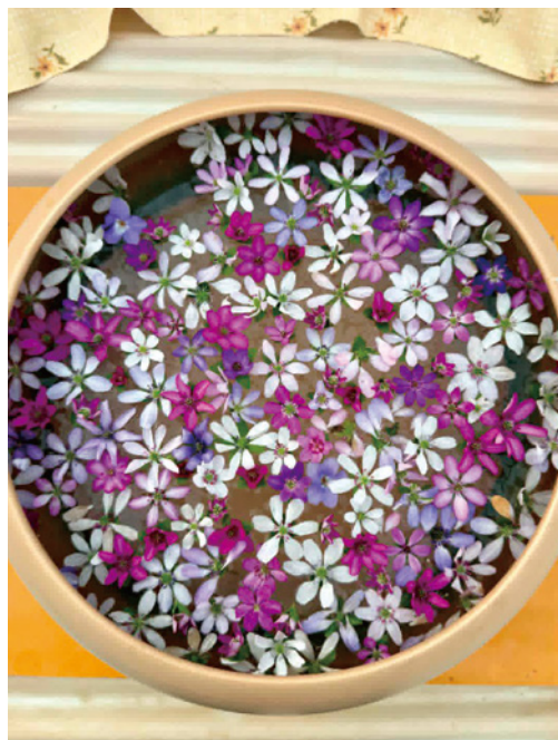
「花手水の円舞曲 (ワルツ)」