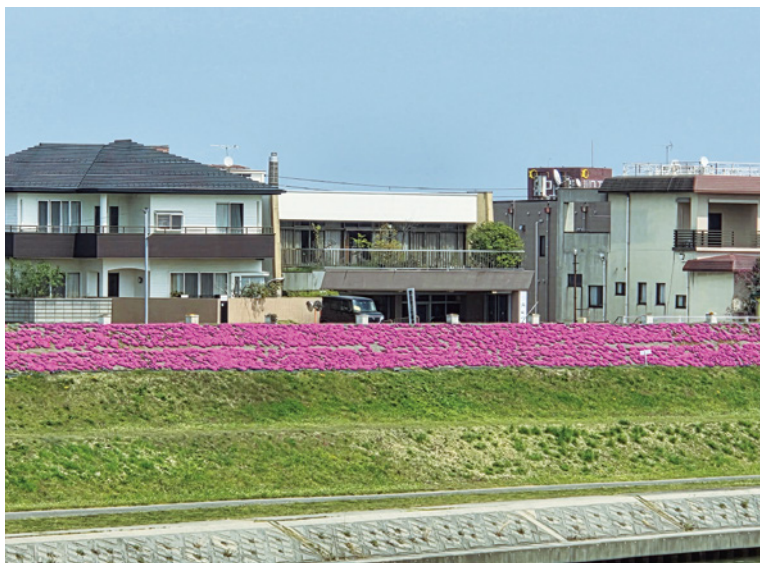
「水辺を縁取る、花の織物。」