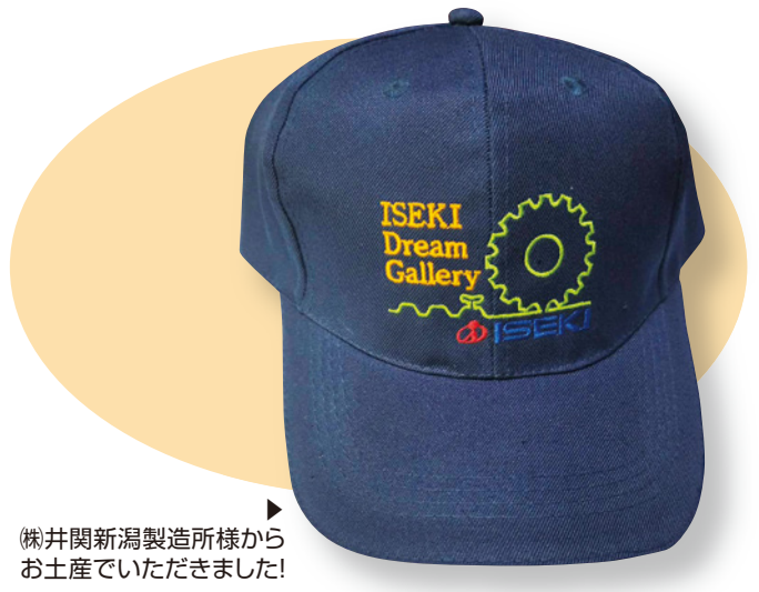
株式会社井関新潟製造所様からお土産いただきました!