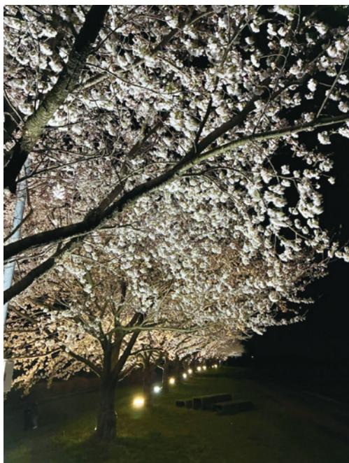
「影向の桜(ようごうのさくら)」