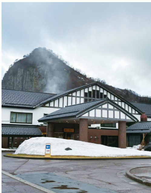
「八木鼻残雪いい湯らてい」