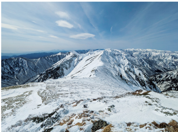
「早春の谷川岳主稜」