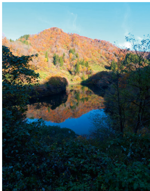
「刈谷田ダムの紅葉」