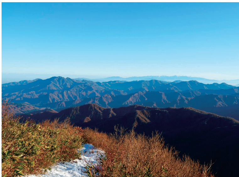
「飯豊、守門に抱かれる栗ヶ岳」