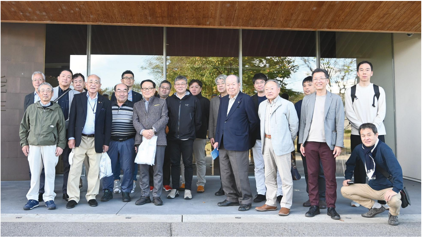
能作さん前で全体集合写真