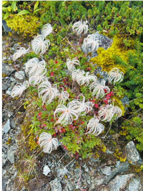
【黒部五郎小屋から鷲羽岳へ、北アルプスに咲くチングルマ】