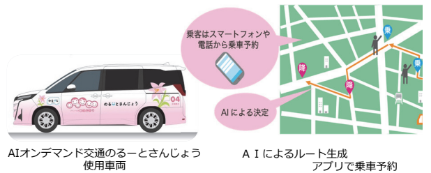
三条市市民部環境課