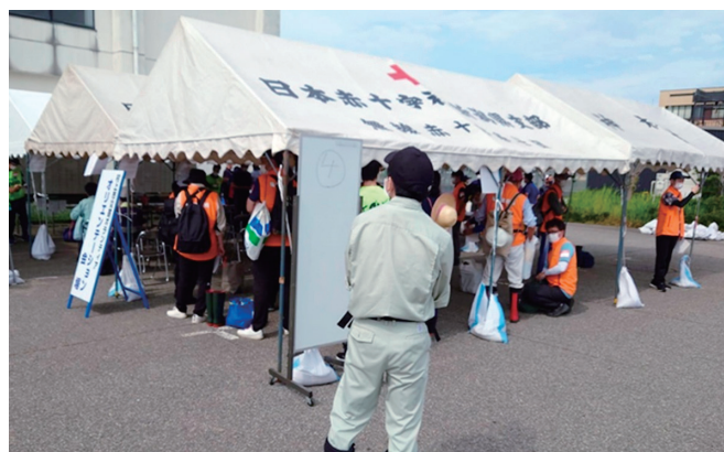
2、8月12日に、村上市の災害ボランティアセンターにアクターが参加した時