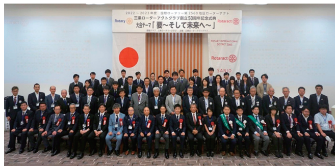
1、50周年記念式典の記念写真