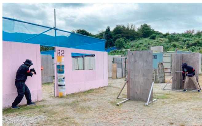
3、10月15日 白根RACサバイバルゲーム例会