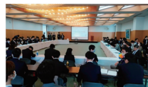
全国RA代表者会議 各地区RA 代表・幹事 代表エレクト・幹事エレクト