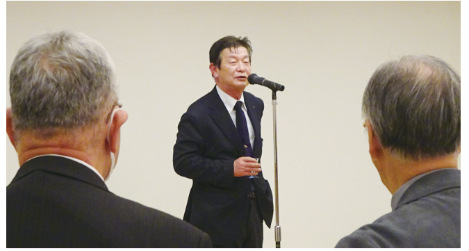
乾杯・歸山 肇直前会長