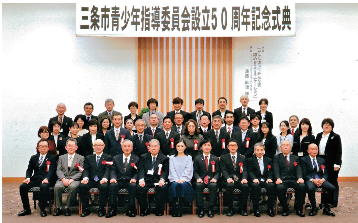
三条市青少年指導委員会 設立50周年記念式典 令和4年11月19日 於 ジオワールド・ビップ