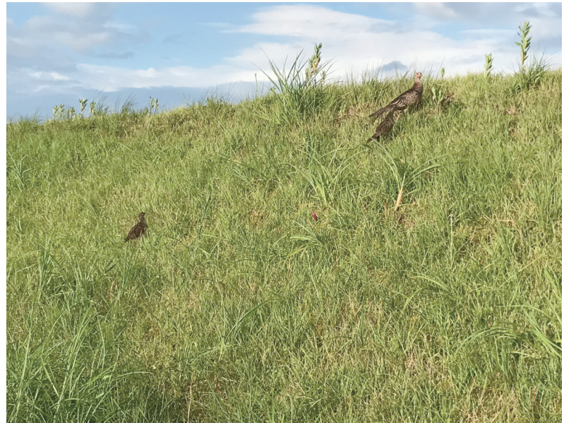
【信濃川河川敷に雉の親子】