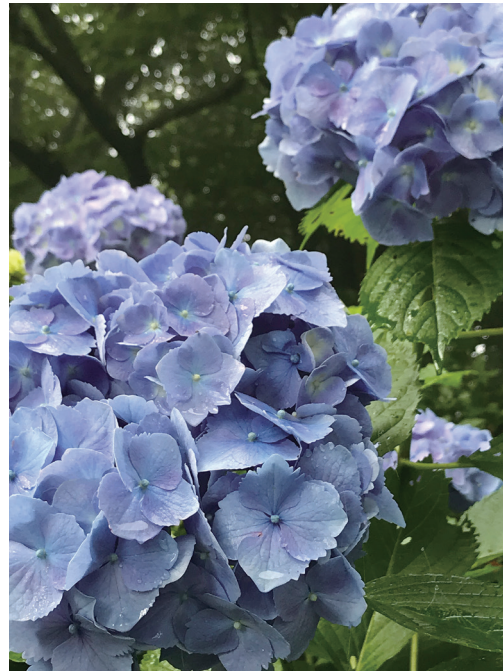
「朝露濡れる紫陽花」