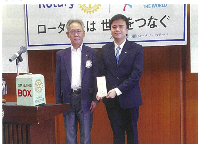
米山記念奨学生チュン君へ奨学金の授与