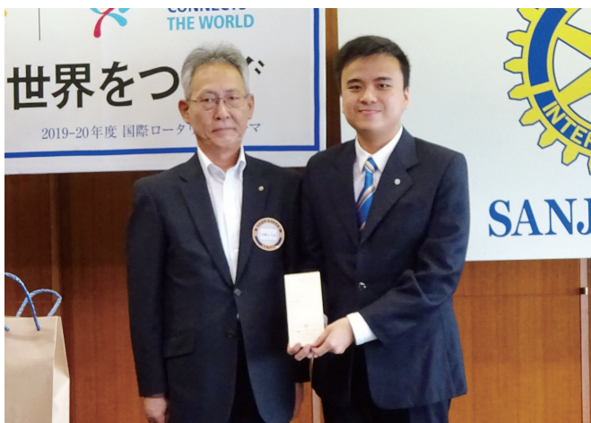
米山記念奨学生チュン君に奨学金の授与