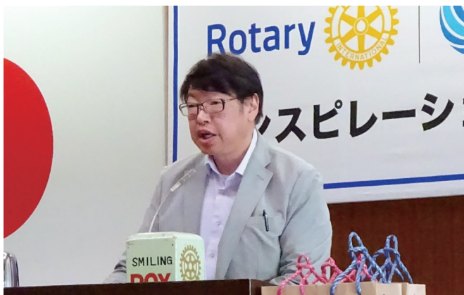
吉井会員より2017-18年度 収支決算報告