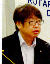
吉井副幹事より予算説明