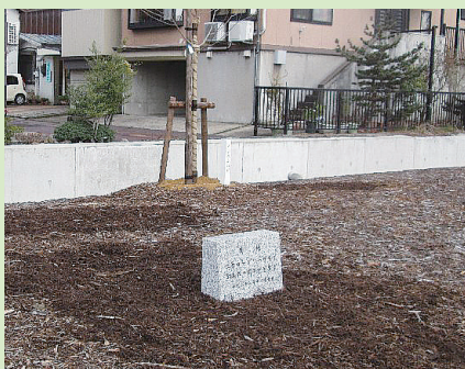
《条南・あおば公園》