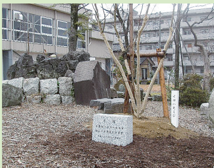
《一ノ木戸・ポプラ公園》