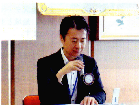
クラブ奉仕B委員長、会報・資料・広報・雑誌委員長