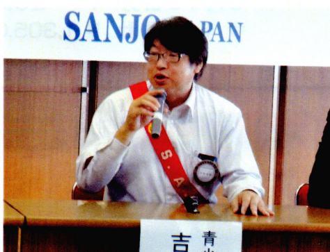
青少年奉仕委員長