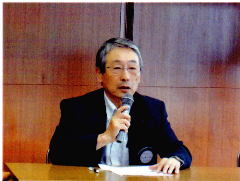
60周年事業実行委員会副委員長、社会奉仕委員長

新企画であり、不手際も多々あるやもしれませんが私の未熟さによるものでありひらにご容赦いただければありがたく存じます。