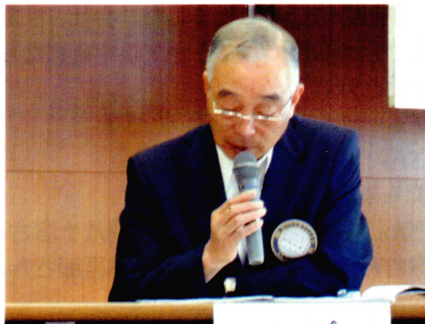
クラブ奉仕A委員長、会員増強委員長