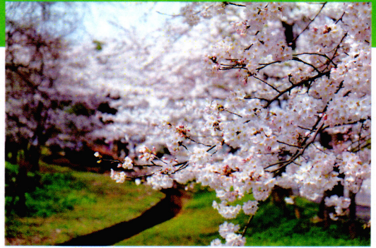
満開のロータリー桜 (4月9日撮影)