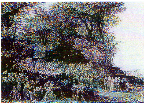
JAN BRUEGHEL (elder) (1568~1625)

自クラブでガバナー補佐として御指導をなどと言われますと、いささか偉くなったような錯覚を覚えます。実はこの「錯覚」が恐ろしい。仏教ではこの錯覚のことを「慢」と言います。自慢の慢です。憍慢の慢です。