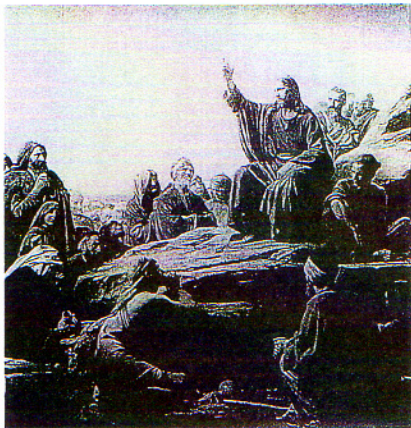
CARL HEINRICH BLOCH (1834~90)