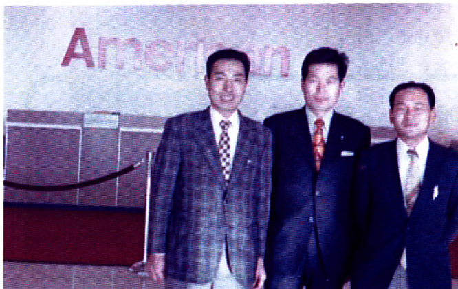
珍しい写真2 今から40年前の写真