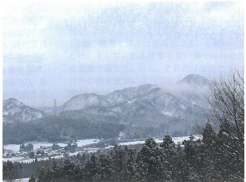
渡辺 稔 会員より