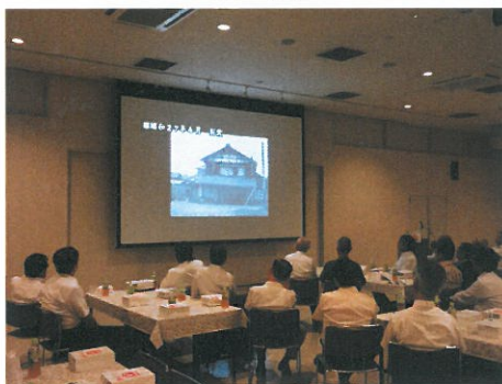
コメリ創業60周年記念ビデオ鑑賞