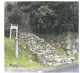
▲山里丸への石段 曾呂利新左衛門の設計といわれている。