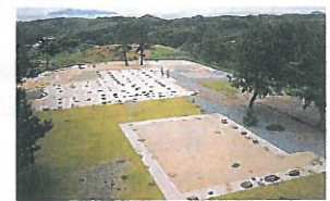
▲堀秀治の陣跡(特別史跡)