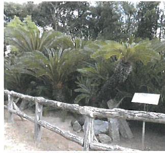
▲広沢寺の大蘇鉄(天然記念物)