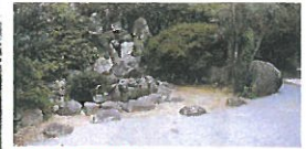
▲法光寺の庭 境内には太閤秀吉お手植えといわれる桜がある。