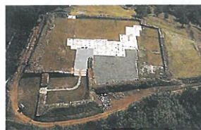
▲豊田秀保の陣跡(特別史跡)