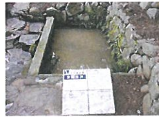
◀太閤井戸(特別史跡)