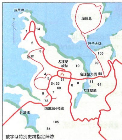
数字は特別史跡指定陣跡 名護屋城を囲んで、160余の全国の諸大名が陣所を設けた。そのうちの23ヶ所が国の特別史跡に指定されている。