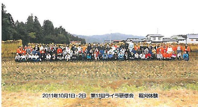
2011年10月1日・2日 第11回ライラ研修会 稲刈り体験