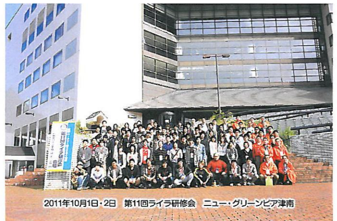
2011年10月1日・2日 第11回ライラ研修会 ニュー・グリーンピア津南