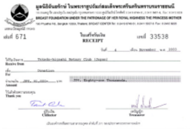
各ロータリークラブ宛の領収書