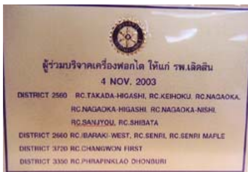
腎臓透析機についてのプレート