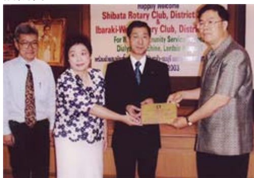
贈呈式 ラーシン国立病院にて