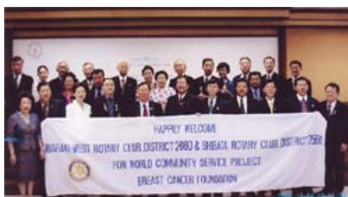
タンヤラック財団