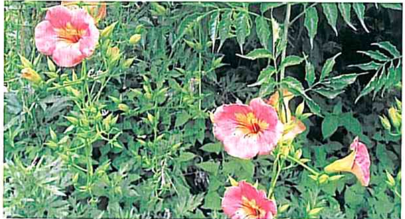
季節のお花 (ノーゼンカツラ)