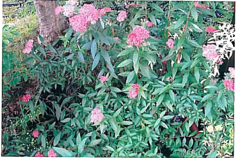
季節のお花 (シモツケ)