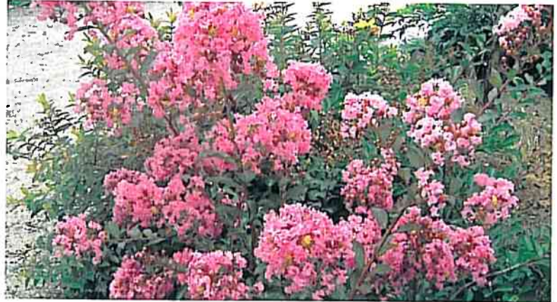
季節のお花 (サルスベリ/百日紅)