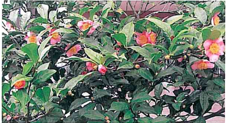
季節のお花 (ロビラキ)