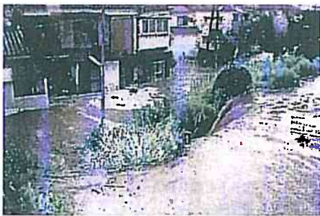
堤防からの越水状況 (三竹地区) (H16.7.13)

実はお手元にも資料をお配りしてありますけれども、私どもが今事業に携わっておりますのは五十嵐川だけではございません。刈谷田川の事業も受け持っておりますし、それから大河信濃川の部分も受け持っております。今回は時間の関係で五十嵐川のみしかお話できませんが、また機会があれば、他の川のお話もしたいという風に思っておりますが、それで今日は時間もあまりございませんので、五十嵐川の今の状況、それから今後どうなるのかといったことを中心に、お話を申し上げたいと考えております。