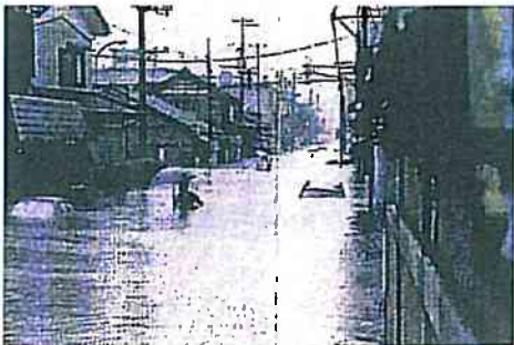
北新保地区浸水状況 (H16.7.13)

まずは五十嵐川の災害復旧助成事業の一番最初のページになるかと思いますが、この写真はまだ災害間もない時の写真であります。広報三条とかそういう風な写真で、以前の状況と今の状況とを見比べる写真を掲載させていただいておりますが、上から見る写真の方が一番見やすいのがありますけれども、