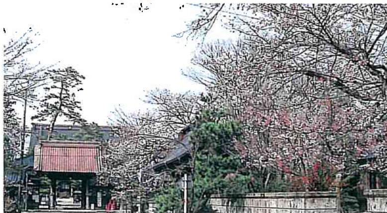
本成寺のソメイヨシノ