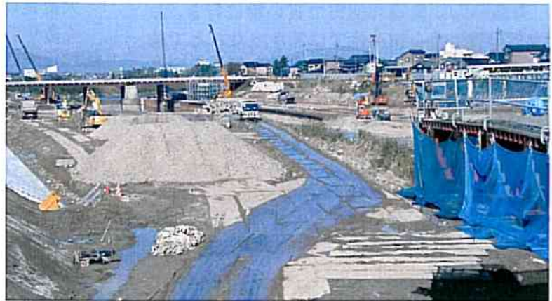
五十嵐川改修工事現場