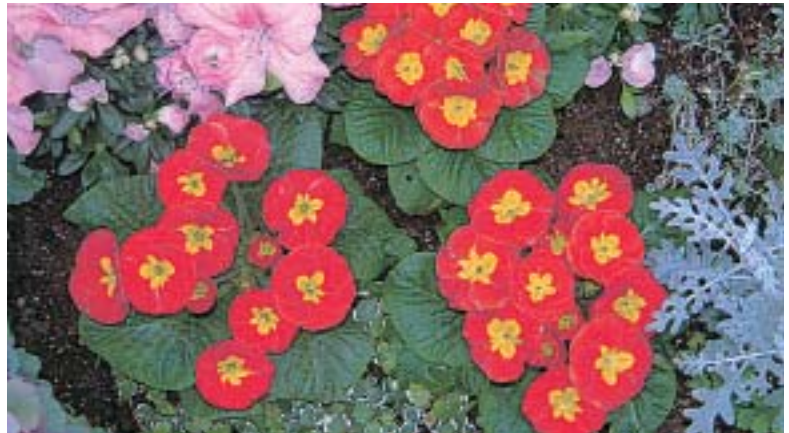
プリムラ ジュリアン

「ロータリーを祝おう 100年の歩み」 2004~2005年度国際ロータリーのテーマ