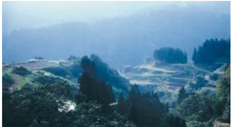
10月17日棚田(山古志村)

「ロータリーを祝おう 100年の歩み」 2004~2005年度国際ロータリーのテーマ